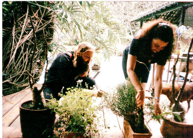
Cultivo de Mudas e Plantas