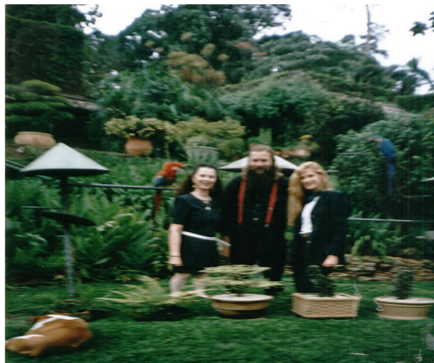
Espécies de Plantas e Vasos Ornamentais