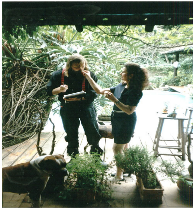
Examinando Espécies de Plantas